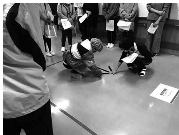
コロナウィルス対策のためのゾーニング訓練