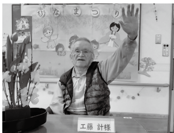
うまく生けましたよ