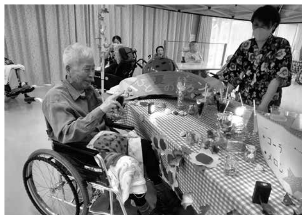
珍しい飲み物やね