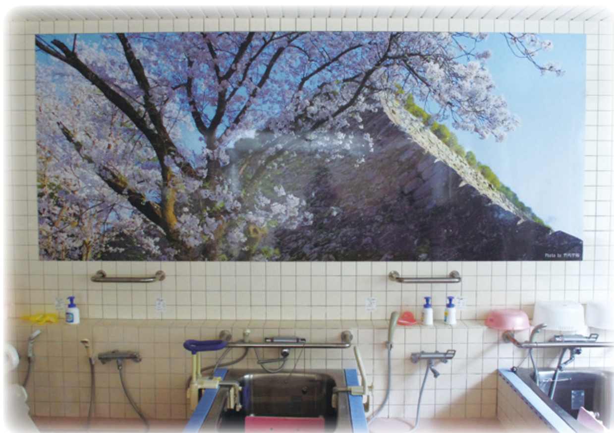
特養浴室のパネル