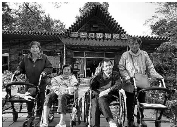
紅葉がきれいでした！