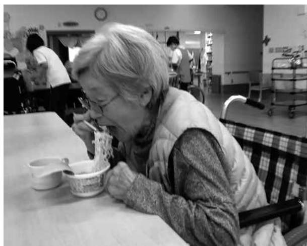
たまにはカップラーメンも良いね