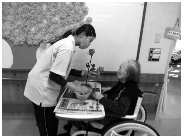
職員と一緒に生けます