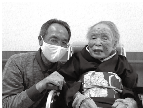
「かけはし」掲載写真