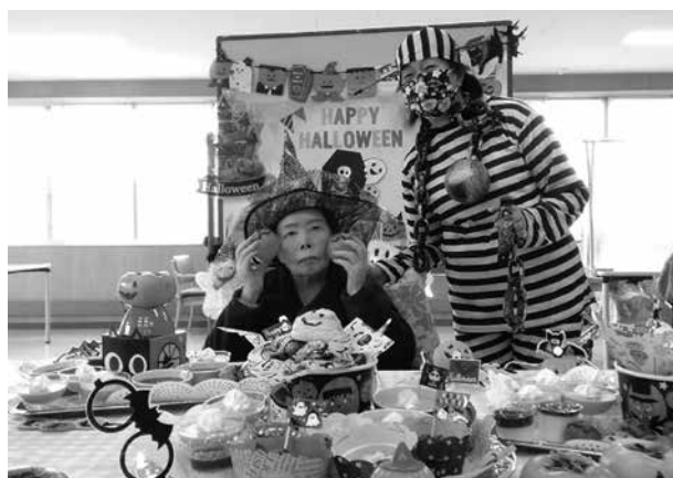
ハロウィンパーティー