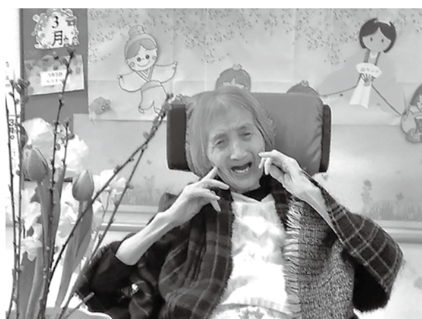
わたしも綺麗でしょう