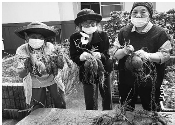
こんなにたくさん採れました

※誕生会は毎月個別に実施（希望があれば衣装を貸し出しドレスや着物など着用） 上記以外にも不定期でホール装飾作製や園芸等を実施