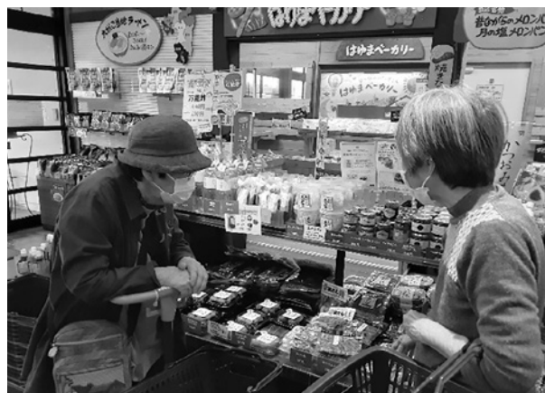
買い物ドライブに行きました